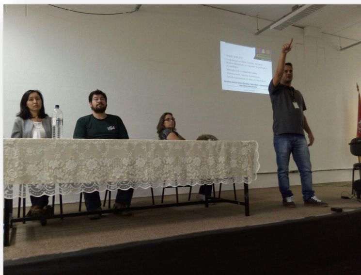
FIGURA 1 – Apresentação da B-So na Calourada 2017

Outra divulgação feita em 2017 foi a participação da B-So na calourada 2017, realizada pelo Campus Sorocaba , em que recebeu os novos alunos dos cursos de graduação, com objetivo de apresentar o espaço acadêmico e divulgar as atividades realizadas no campus.