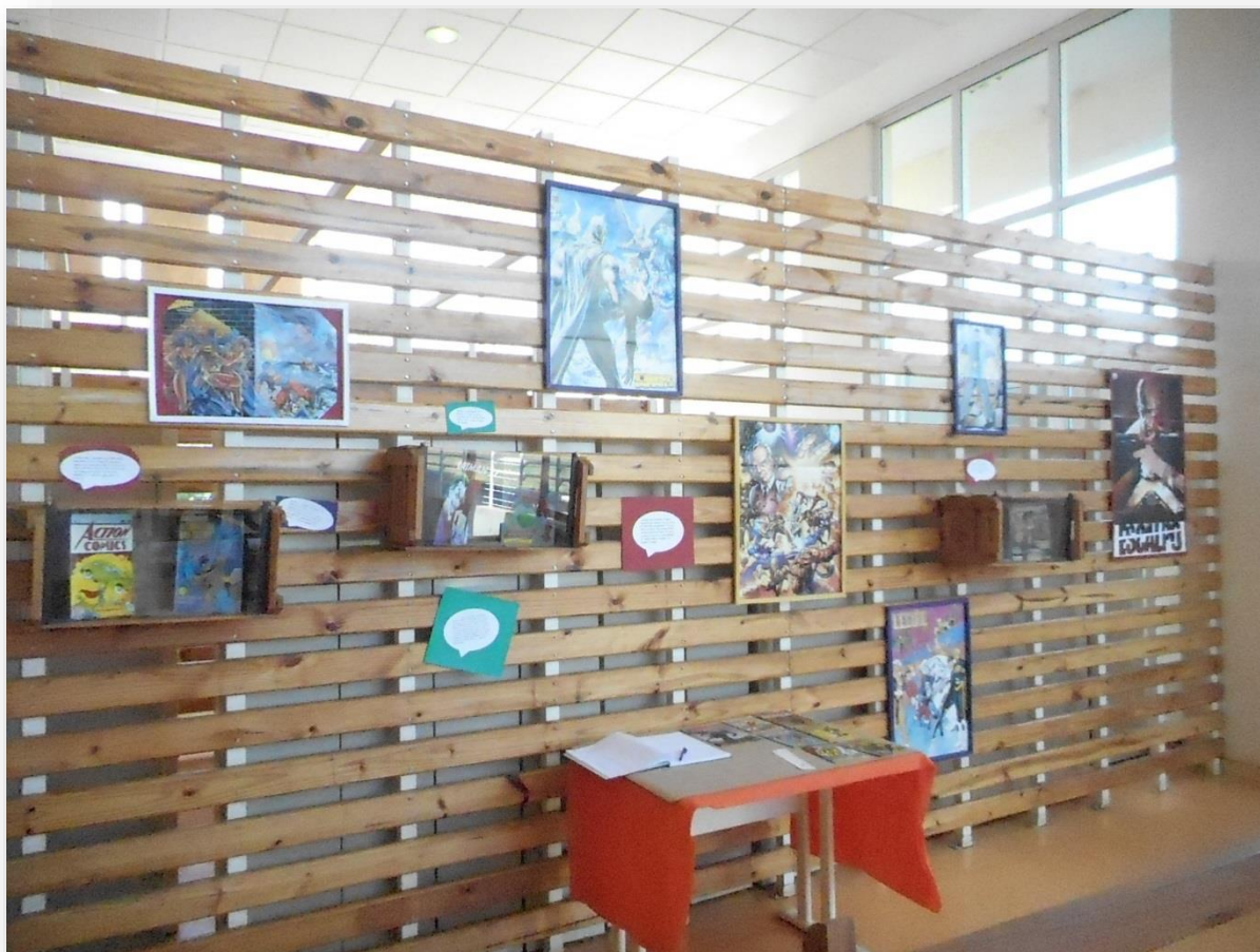
FIGURA 14: Exposição HQ

Crédito: Maria Aparecida de Lourdes Mariano