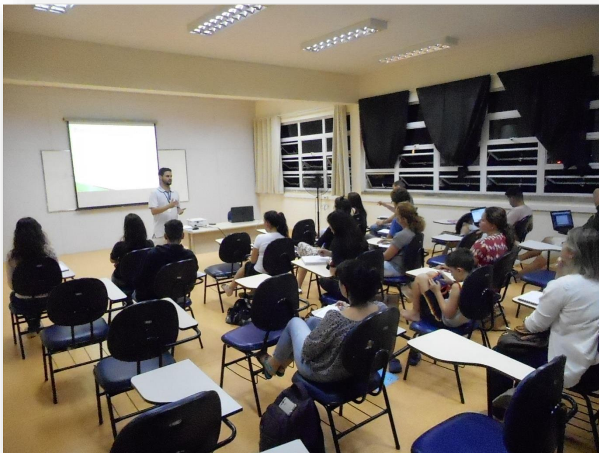
FIGURA 6 – Oficina Currículo Lattes