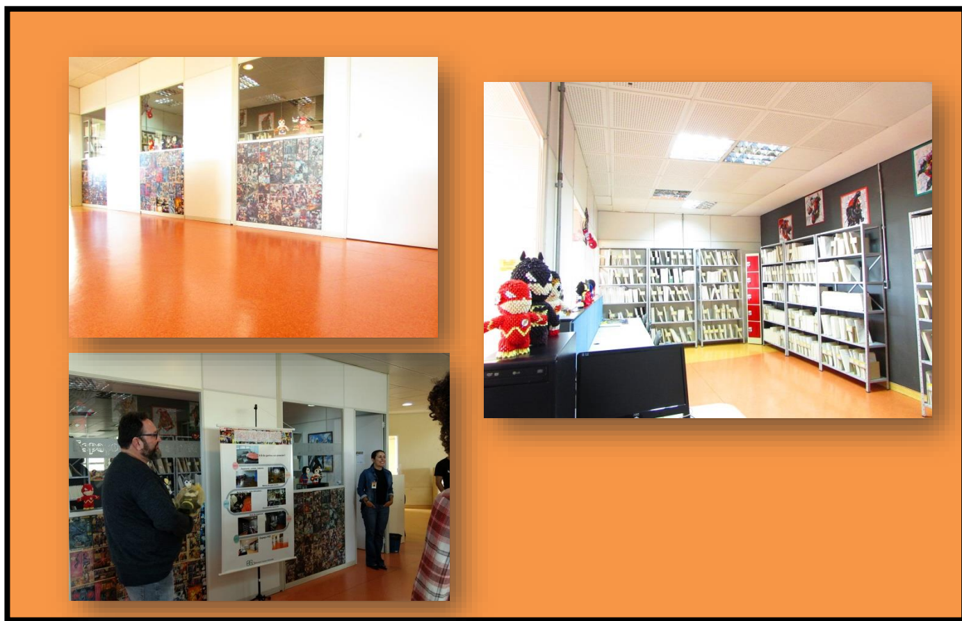
FIGURA 25 – Sala dos Quadrinhos: vista externa e interna