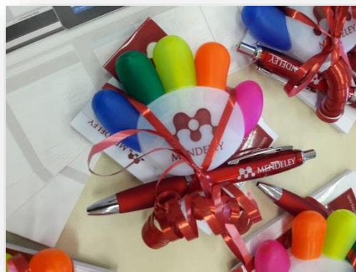
FIGURA 5 – Kit Mendeley