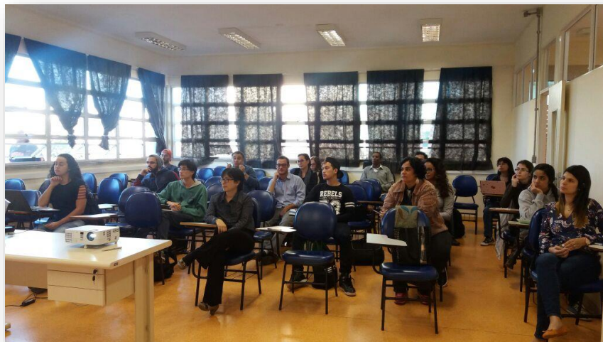
FIGURA 2 – Curso de recursos informacionais como ferramenta para a produção do conhecimento