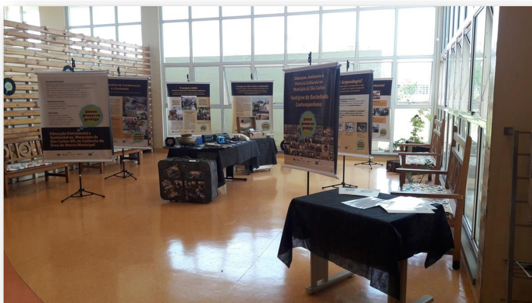
FIGURA 18: Exposição "Vestígios da Sociedade Contemporânea"