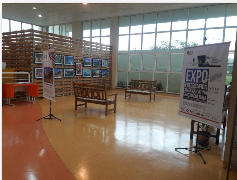
FIGURA 17: América Latina Nação Cultura

Crédito: Maria Aparecida de Lourdes Mariano