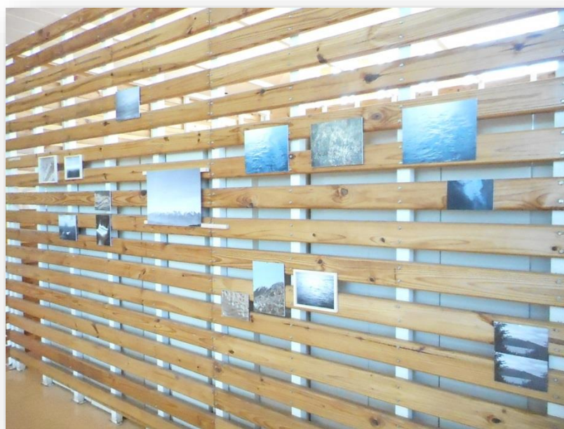
FIGURA 16: Exposição Derivas Continentais