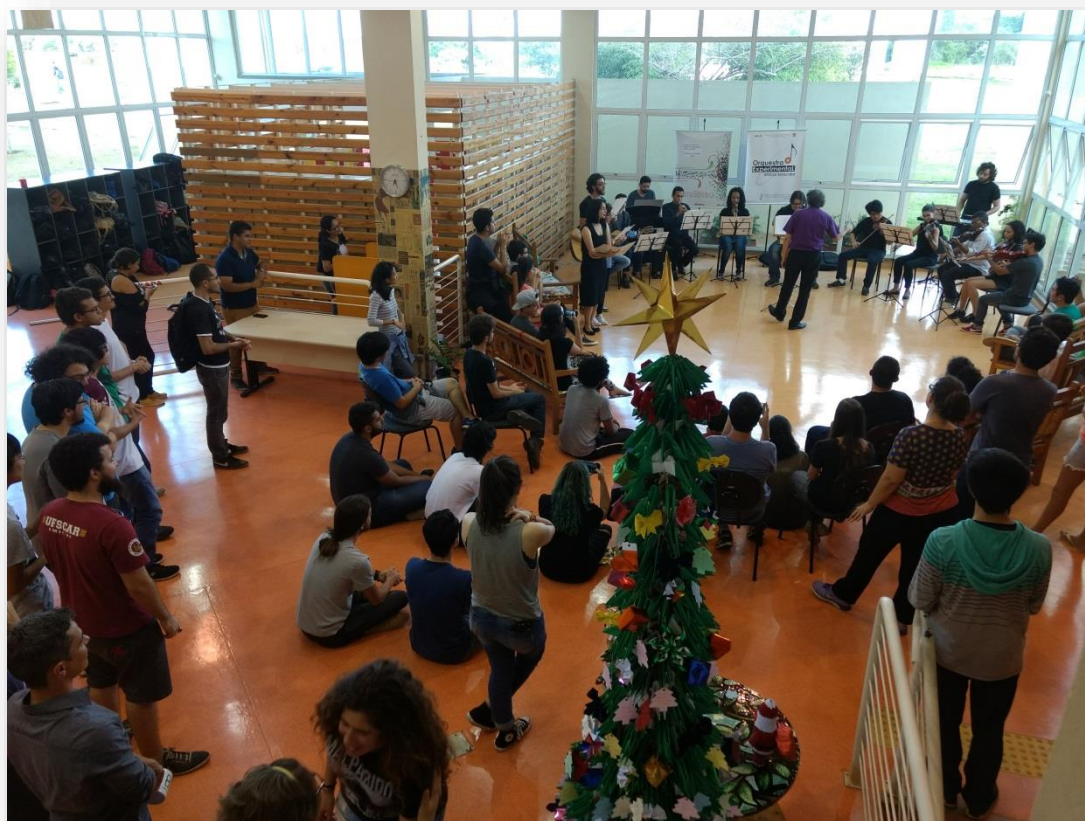
FIGURA 10 – Orquestra Experimental da UFSCar Sorocaba, no saguão da Biblioteca

No dia 12 de dezembro, a Orquestra Experimental da UFSCar Sorocaba fez um concerto de Natal na Biblioteca Campus Sorocaba (B-So), com duração de 1 hora.