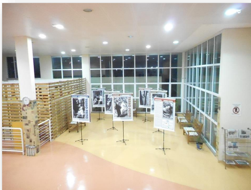
FIGURA 18: Exposição “Tenho peito”

A exposição fotográfica instalada na B-So em outubro abordou a importância da amamentação prolongada.