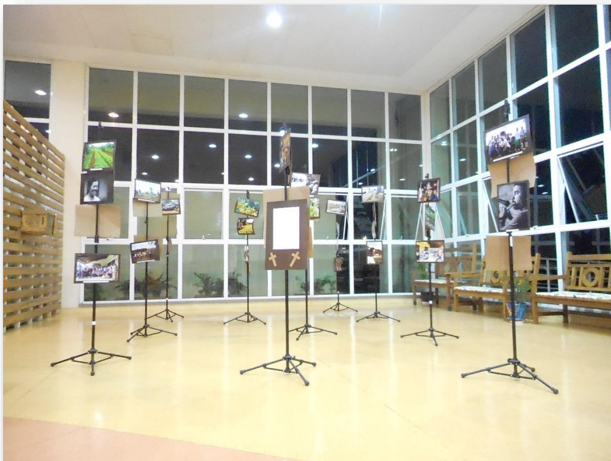
FIGURA 15: Exposição “Reforma agrária”

A exposição visa compor a ocupação do campus Sorocaba em relação ao Abril Vermelho, mês de luta em memória e denúncia ao massacre de membros do Movimento dos Trabalhadores Rurais Sem Terra (MST) em Eldorado dos Carajás/Pará em 1996.