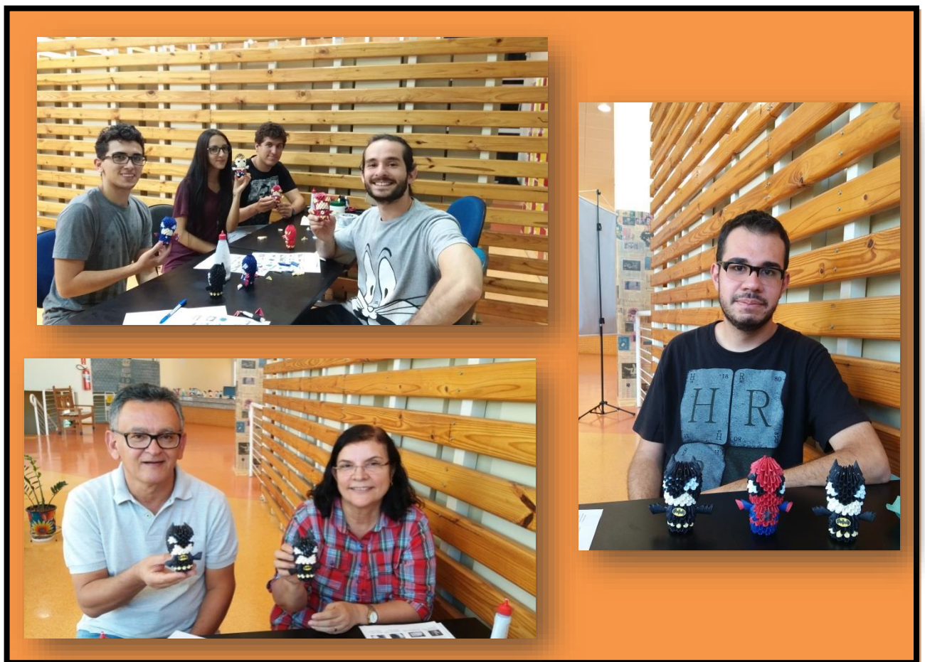
FIGURA 3 – Oficina de origami 3D

As oficinas aconteceram em duas edições, 03 e 04 de abril e durante todo o mês de setembro, em diferentes horários para atender a demanda de interessados.