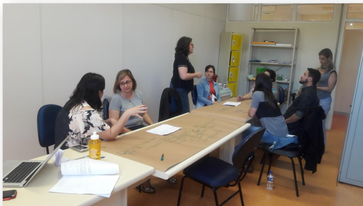
FIGURA 19: Câmara Técnica de Catalogação em Sorocaba