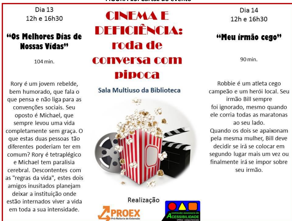
FIGURA 13: Cartaz do evento

Esse evento teve o patrocínio da Pro-Reitoria de Extensão, o apoio da Secretaria de Ações Afirmativas e faz parte das atividades II FÓRUM DE AÇÕES AFIRMATIVAS, DIVERSIDADE E EQUIDADE DA UFSCar.