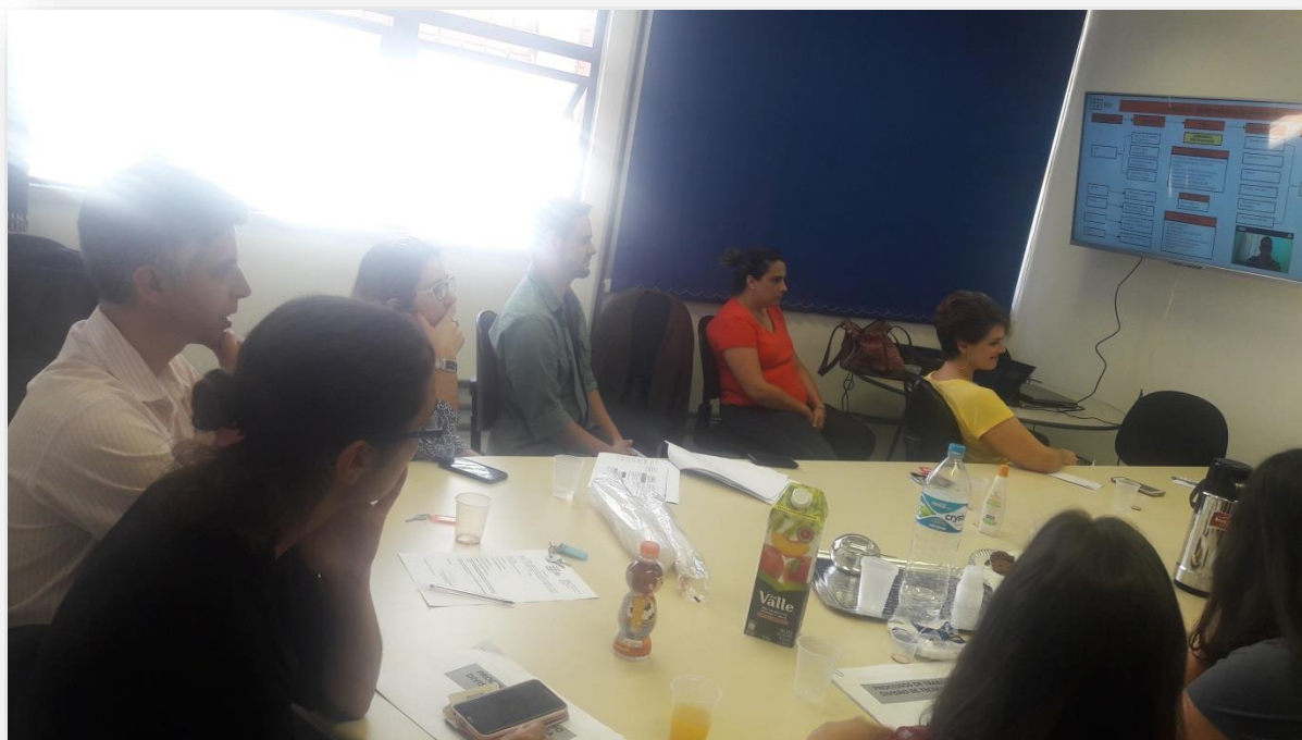
FIGURA 20: Reunião do Comitê Gestor em São Carlos