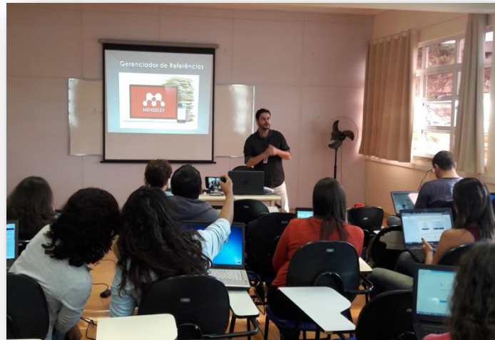
FIGURA 4 – Oficina Mendeley